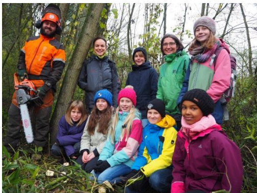
Madame Landammann Manuela Weichelt (en vert) rend visite aux participantes de l'atelier forestier organisé par l'Etat du Canton de Zoug.

garçons dans des domaines «divers» a aussi considérablement augmenté puisque ce sont 416 places qui étaient proposées cette année contre 159 en 2016. L'atelier «Un jour en tant que vétérinaire» a doublé les places grâce à la clinic vétérinaire de Zurich.