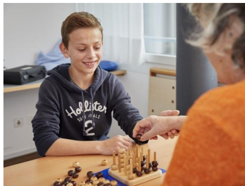
Un élève apprend à faire connaissance avec le métier d'ergothérapeute dans le cabinet "ergobern – Praxis für Ergotherapie Jacqueline Bürki".