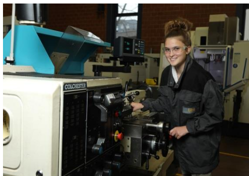
Une participante à l'atelier Fille et Technique chez LIBS à Zürich.