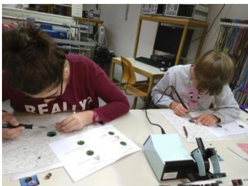
Les écolières s'appliquent durant l'atelier d'ingénierie de la HES-SO de Sion, Valais.