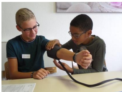
Des élèves prennent la pression artérielle à l'Ecole professionnelle de Santé-Social de Grangeneuve, Fribourg.