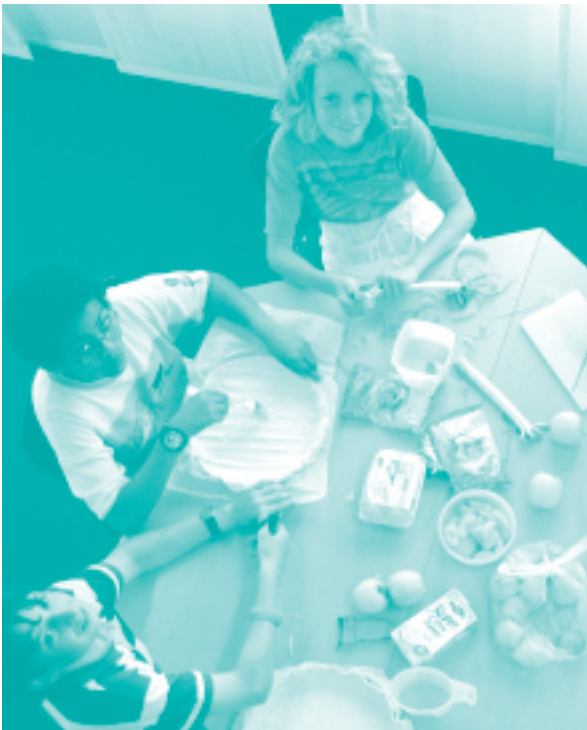
Projets pour les garçons à Hünenberg