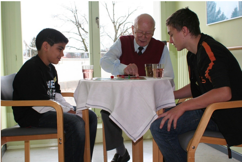
De jeunes écoliers participent avec attention à une activité avec un résidant d'un home pour personnes âgées.