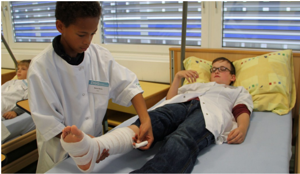
La pose d'un pansement se fait de manière concentrée.