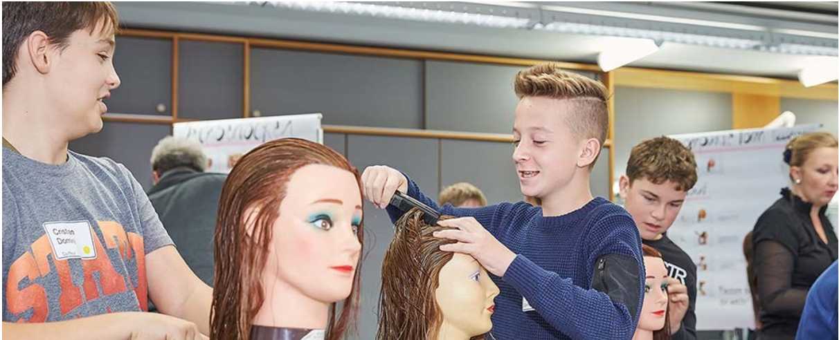
Image: Garçons à la découverte du métier de coiffeur au centre de formation professionnelle de Zoug

A l'occasion de la journée Futur en tous genres, les garçons de la 7e à la 9e HarmoS (du canton de Berne, de 8H pour le Valais, de 10H pour Fribourg, de 7P pour Genève et de 9H pour Neuchâtel) sont invités par les centres de formation professionnelle et par les instituts de coiffure à découvrir leur métier. Les garçons accompagnent une coiffeuse ou un coiffeur sur son lieu de travail, l'aide dans ses activités et expérimentent leur habileté dans ce travail. L'objectif de l'atelier « à la découverte du métier de coiffeur » est de susciter l'intérêt des garçons pour ce travail.