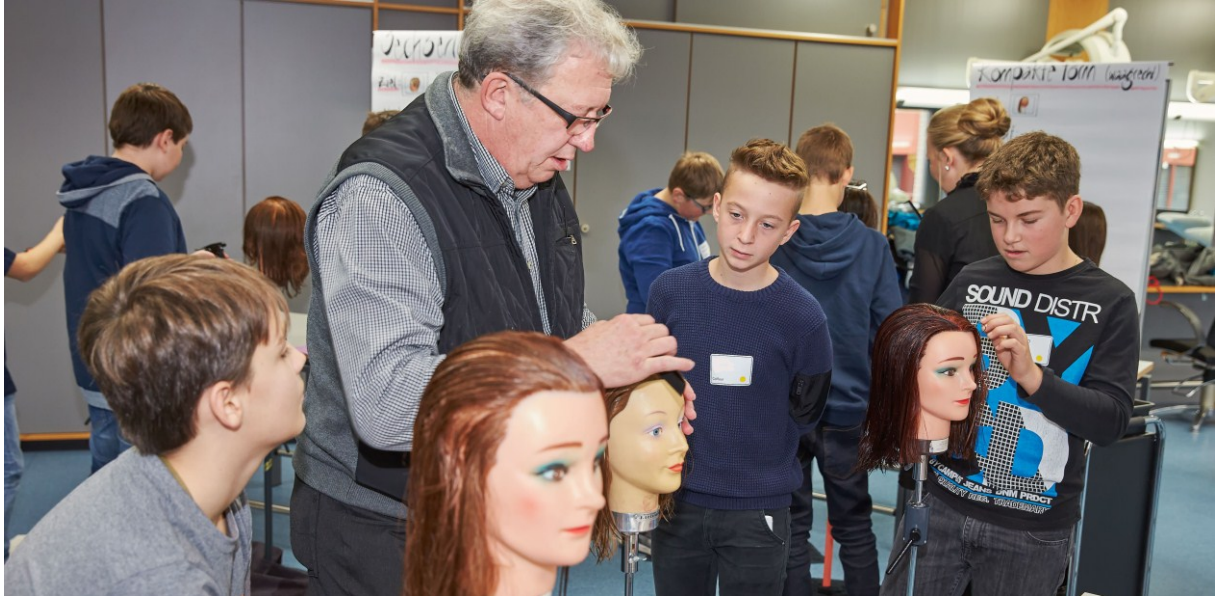
Image: Garçons à la découverte du métier de coiffeur au centre de formation professionnelle de Zoug

Nouvelles perspectives pour filles et garçons